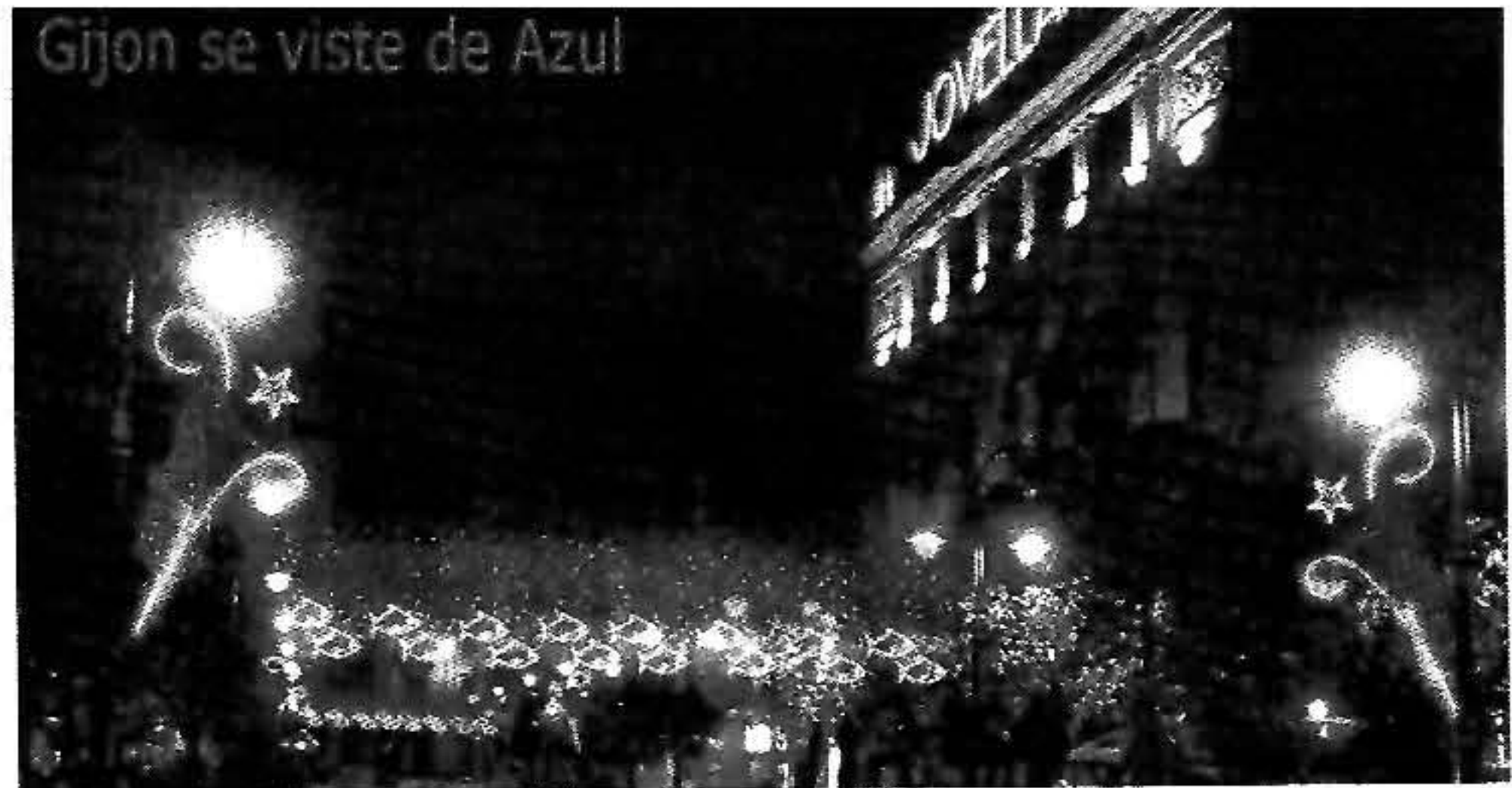
Gijón se viste de Azul

La propuesta pinta un Gijón iluminado de azul aunque el jurado consideró que este color era poco apropiado para la ciudad cuyo color de referencia es el rojo. Otro inconveniente está en el alto coste de cada elemento decorativo que llevaría a colocar menos adornos para ajustarse al presupuesto.