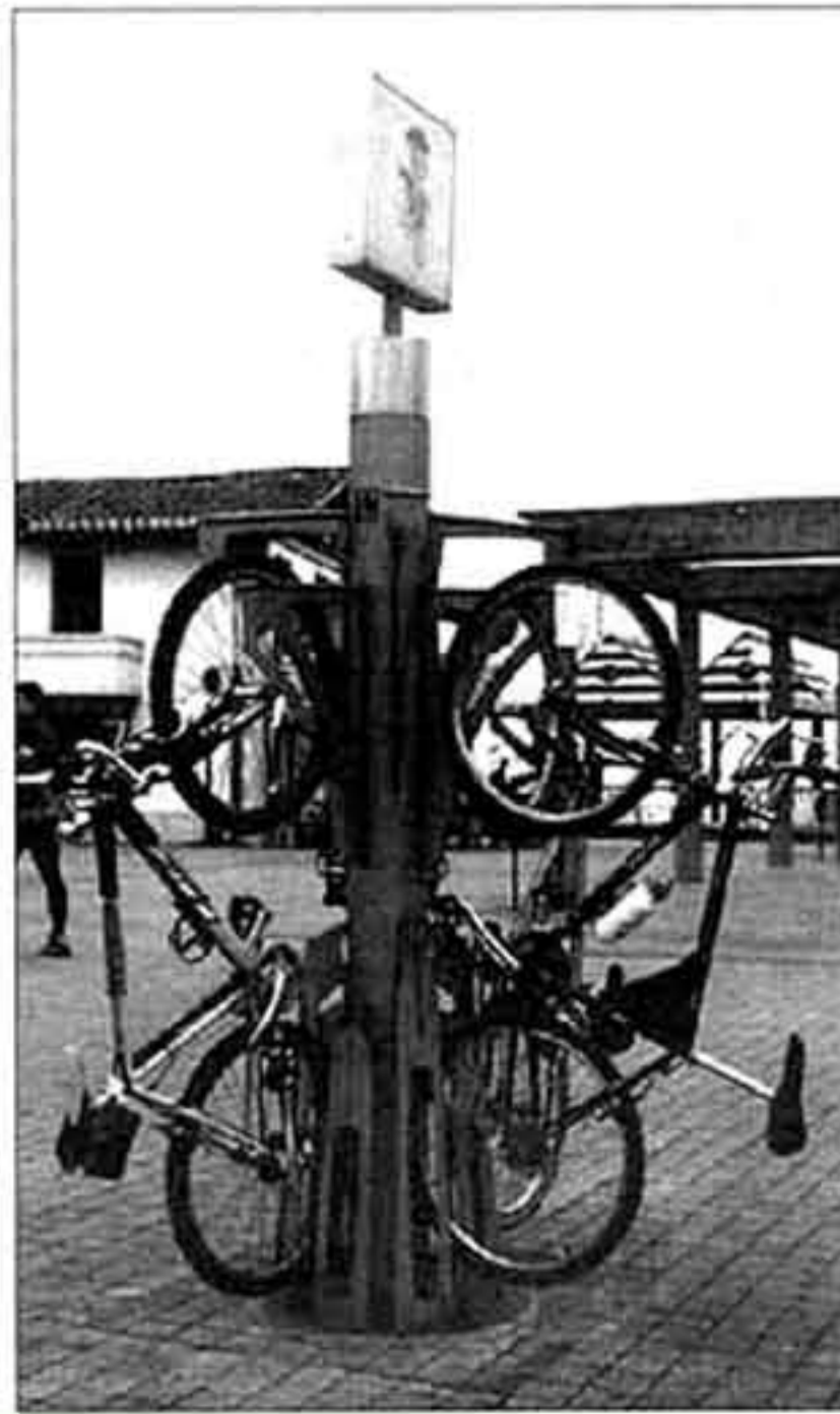
La compañía bilbaína ha diseñado y patentado un curioso aparabicic vertical, que entre otras playas, está ya instalado en la de La Arena en Muskiz.

R: Creo que el principal problema es que no se ha reconocido aún la realidad de la profesión. No hay una definición legal, no existen un plan de estudios específico y esto provoca que en cada lugar se plantee una forma de trabajar diferente. Esperemos que poco a poco se estructure, ya que el beneficio para la red industrial será muy grande.