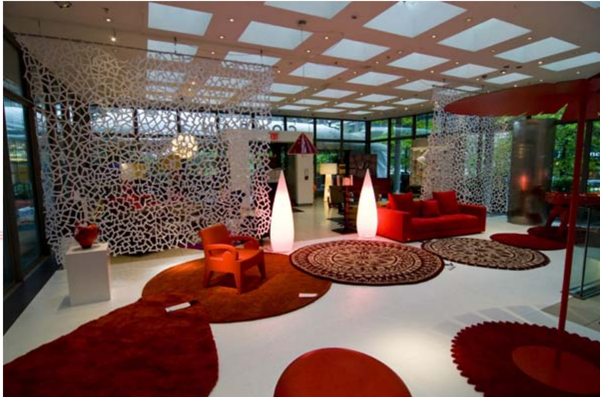
Exposición Rojo en Conran Shop Nueva York

Del 16 del mayo al 8 de junio, coincidiendo con la celebración de la feria ICFF en Nueva York, el ICEX, en colaboración con la Oficina Comercial de Nueva York, ha presentado una exposición monográfica de diseño español llamada ROJO, que está desarrollándose en una de las tiendas más emblemáticas de Manhattan: "The Conran Shop".