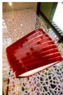
Boomerang de Almerich