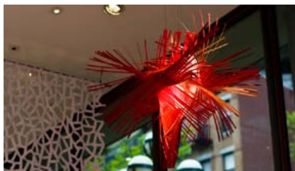
Mikado de Luzifer

La fiesta de inauguración de la exposición se celebró el día 16 y congregó a numerosos arquitectos, diseñadores, empresarios y público en general, acudiendo cerca de 2.000 personas para disfrutar del mejor diseño español.