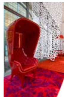
Showtime de BD Barcelona