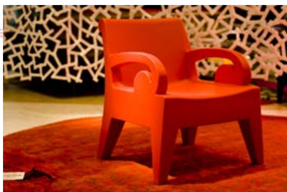
Novecento de Capdell